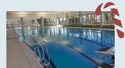
Es gibt wieder das beliebte Warmbaden im Hallenbad Schwarmstedt.

montags und samstags ist das Hallenbad geschlossen.