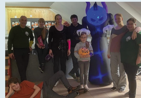
Viel Spaß beim Halloween-Schießen hatten die Schützen aus Hope.

Im letzten Monat wurde die Vereinsmeisterschaft des SV Hope auf der Innenbahn des Dorfgemeinschaftshauses in Hope ausgeschossen. Insgesamt 16 Vereinsmitglieder traten in unterschiedlichen Wettkampfgruppen an. Zehn Teilnehmer sind für die Kreismeisterschaft in der Sporthalle des Schulzentrums in Walsrode gemeldet. Auch dieses Jahr fand wieder das „Süßes-oder-Saures-Schießen“ im Dorfgemeinschaftshaus statt. Das vereinsinterne Turnier findet jedes Jahr zu Halloween statt. Die Schützen schießen dabei auf Auflagen mit Halloweenmotiven . In diesem Jahr gab es noch eine Besonderheit: eine Fledermaus hing von der Decke – natürlich kein echtes Tier, sondern aus Gummi im 3D-Druckverfahren.