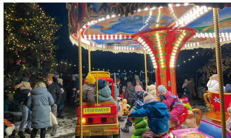
Immer das Highlight der Kleinsten: Das Kinderkarussell am Weihnachtsbaum

Wir von der Redaktion des Dorf-Echos nutzen auch die Chance und verteilten rund 100 Schokoadventskalender an die Jüngsten unseres Dorfes. Der Weihnachtsmarkt war wieder die perfekte Einstimmung auf die winterliche Weihnachtszeit in unserer Gemeinde.