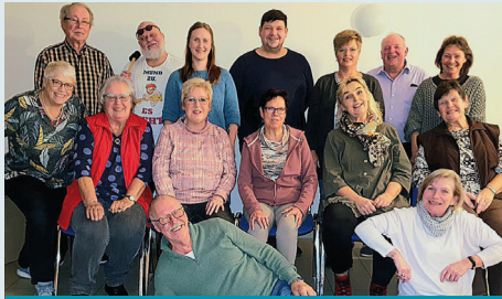
Das Ensemble Lampenfieber freut sich auf die Auftritte

Verabschieden wollen wir uns nach mehr als 20 Jahren von unserem alten Logo. Unser neues Logo , entworfen von Luisa Frenzel , ist moderner und unserer Meinung nach ansprechender. Außerdem haben wir wieder eine Website ( www.lampenfieber-lindwedel.de ), unter der alle Neuigkeiten und wichtigen Kontakte sowie die Vorverkaufsstellen und Kontaktadressen für die Kartenreservierungen entnommen werden können. Wir wollen ja nicht zu viel verraten, aber hier eine kurze Inhaltsangabe des neuen Stückes: