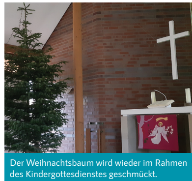
Der Weihnachtsbaum wird wieder im Rahmen des Kindergottesdienstes geschmückt.

Außerdem werden am 13.01.2024 ab 9 Uhr wieder Jugendliche für „Tannenbaum ade“ unterwegs sein und die abgeschmückten Bäume einsammeln - und dabei gleichzeitig auch an den Türen um Spenden für die Kinder- und Jugendarbeit bitten. Schon jetzt möchten wir um ein „Save the date“ für den 20. Januar 2024 um 18:10 Uhr bitten - an diesem Abend macht TriOle im Gemeindezentrum den Auftakt zur neuen Gott und die Welt - Reihe. Der Eintritt ist frei, Spenden werden zugunsten von „Casa Verde“ gesammelt.