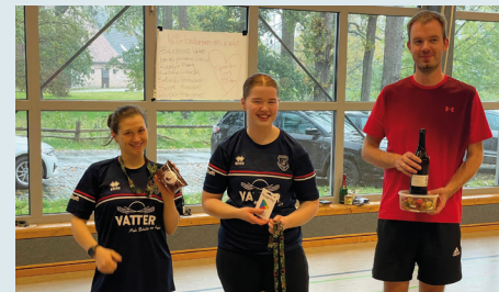
Viel Spaß mit tollen Preisen gab es beim Badmintonturnier

Im letzten Monat veranstalteten wir unser Schleifchenturnier. Für alle Teilnehmerinnen und Teilnehmer gab es tolle Preise. In den Pausen konnten sich alle mit Leckereien vom Grill, frischen Waffeln und Getränken stärken und tolle Gespräche führen. An dieser Stelle sagen wir ganz herzlich Danke an unsere Sponsoren: Bäckerei Vatter, Bonus Personal Service, Erlebnis-Zoo Hannover, Balland's Hotel & Restaurant Lindwedel, Randy's Pizza, Friseursalon Haar Oase und Sport Haeuser. Wir haben jetzt schon entschieden, dass wir dieses Turnier