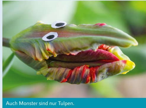
Auch Monster sind nur Tulpen.