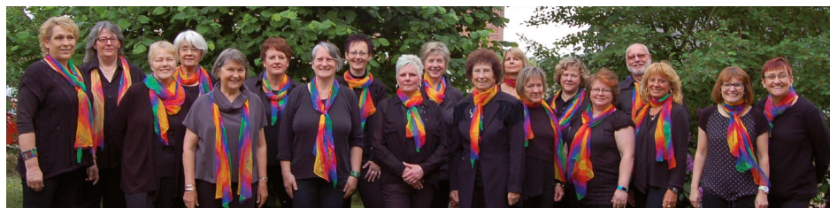
Der Chor „Sing for Fun“ bei einem der früheren Auftritte.