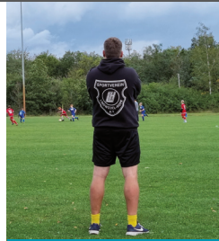
Werde Trainer beim SVLH

Omas, Opas, Mütter, Väter, fußballbegeisterte „junge“ und „alte“ Erwachsene, erfahrene Trainer:innen und Fußballer:innen – aufgepasst: Der SV Lindwedel-Hope e.V. benötigt eure Unterstützung! Wir sind Trainer:innen im Ehrenamt und freuen uns über jedes Kind und jeden Jugendlichen, der Spaß am Sport hat oder diesen entdecken möchte. Wir als Trainer:innen gehen darin auf, den Kindern und Jugendlichen, diese Möglichkeit zu bieten. Leider sind unsere Möglichkeiten als ehrenamtliche Trainer:innen begrenzt. Arbeit und Familie dürfen ja auch nicht zu kurz kommen. Wir wollen niemanden wegschicken! Deshalb seid nun ihr gefragt! Wer kann helfen und die Kids 1-2 Mal pro Woche trainieren und bei Wettkämpfen coachen? Wer von euch hat Spaß am Sport, Spaß an der Arbeit mit den Kids, Interesse am Fußballsport, Lust darauf, den Kindern Neues beizubringen und ihren natürlichen Bewegungsdrang zu fördern sowie das Training zuverlässig, anzubieten. In den jüngeren Jahrgängen könnten sich Omas, Opas, Mütter, Väter und andere fußballbegeisterte Menschen engagieren. Für die älteren Jahrgänge wäre es toll, wenn du bereits Erfahrungen als Trainer:in und/oder Fußballer:in sammeln konntest. Unser tolles Trainerteam unterstützt euch. Ihr lernt neue Menschen kennen und bekommt das typische Gemeinschaftsgefühl eines Vereins zu spüren. Ihr habt Interesse, Fragen, Bedenken oder wollt direkt loslegen? Dann meldet euch bei uns! Ansprechpartner ist Thomas Klette unter 0177-3430044 .