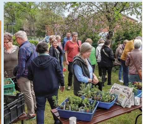
2023 hatte die Pflanzentausch-Börse bestes Plauderwetter