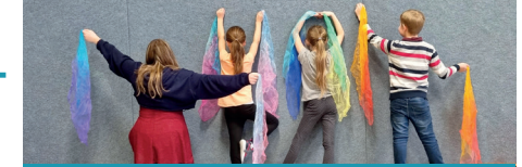
Jeden Dienstag wird in der Sporthalle Lindwedel fleißig getanzt, macht mit!

Wer Kinder aufmerksam beobachtet, weiß, wie gerne sie singen und tanzen.