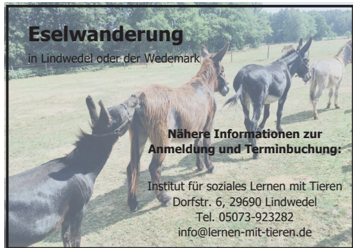
Nähere Informationen zur Anmeldung und Terminbuchung: Institut für soziales Lernen mit Tieren Dorfstr. 6, 29690 Lindwedel Tel. 05073-923282 info@lernen-mit-tieren.de