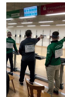
Ein Team sind die Jungs seit der Jugend und deshalb auch gemeinsam im Wettkampf erfolgreich.